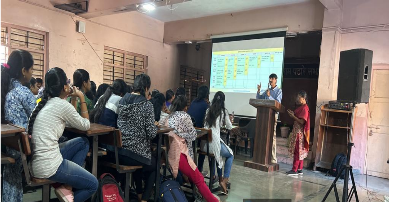
The Guest Lecturer is conducting the lecture by using ICT's