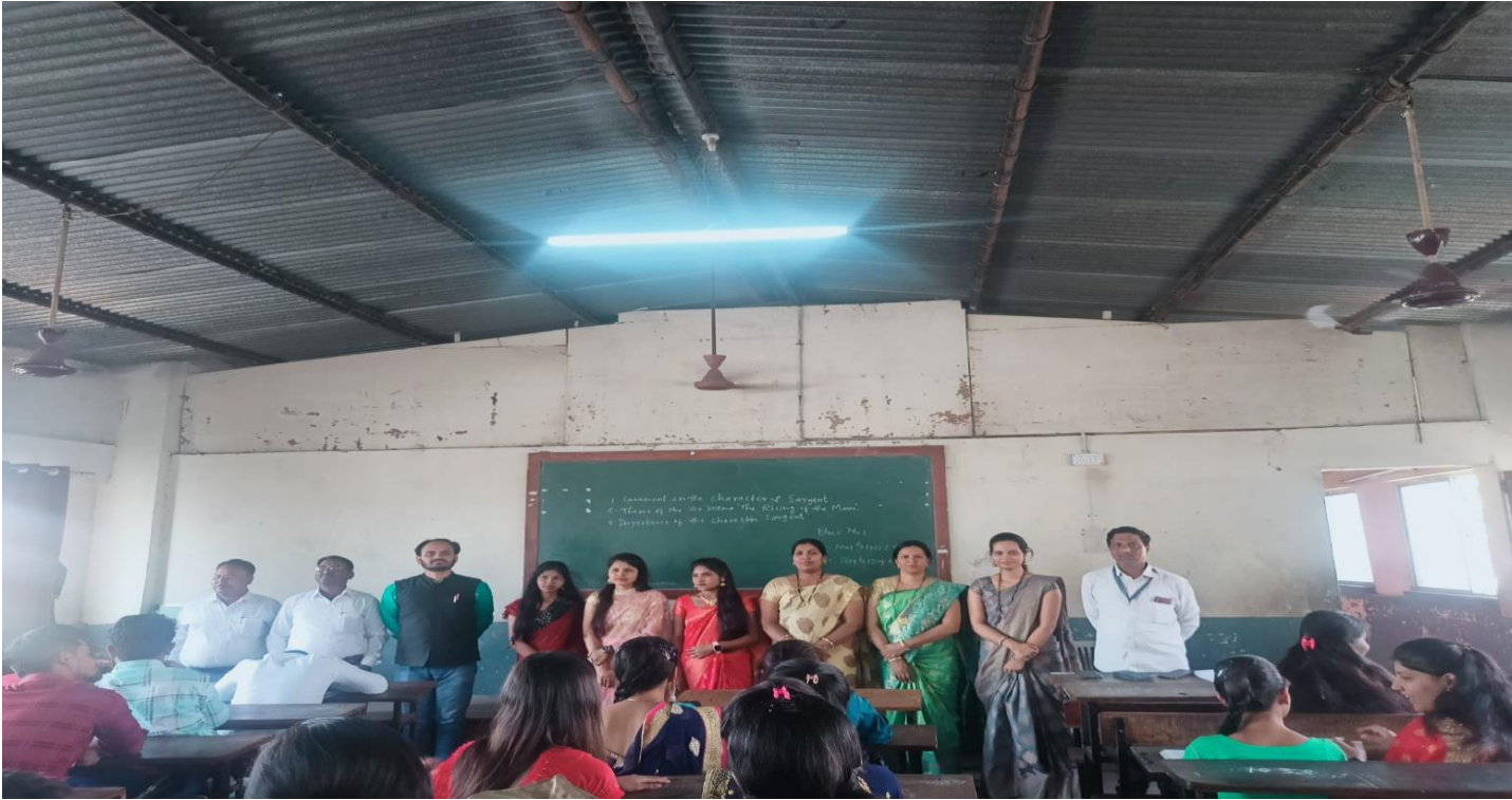
Our Teachers and Students during group discussion.